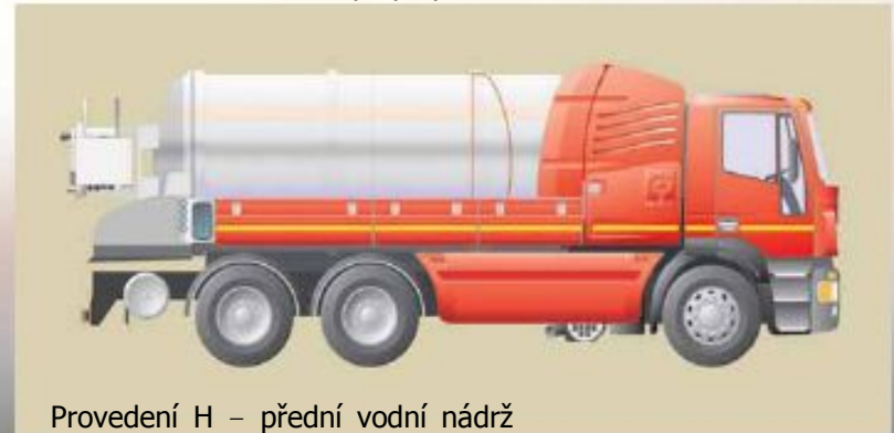
Provedení H – přední vodní nádrž