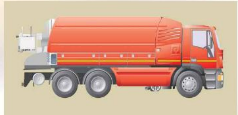
Provedení V – boční polyetylenové nádrže

Řada Elegance nabízí tři různá provedení vodních komor: boční polyetylenové nádrže, přední nádrž a dvojitá vnitřní nádrž.