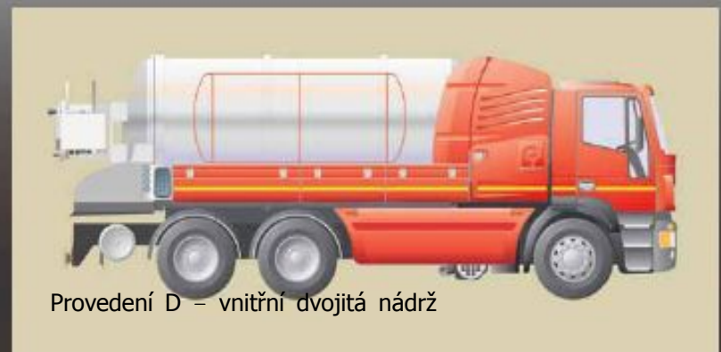
Provedení D – vnitřní dvojitá nádrž